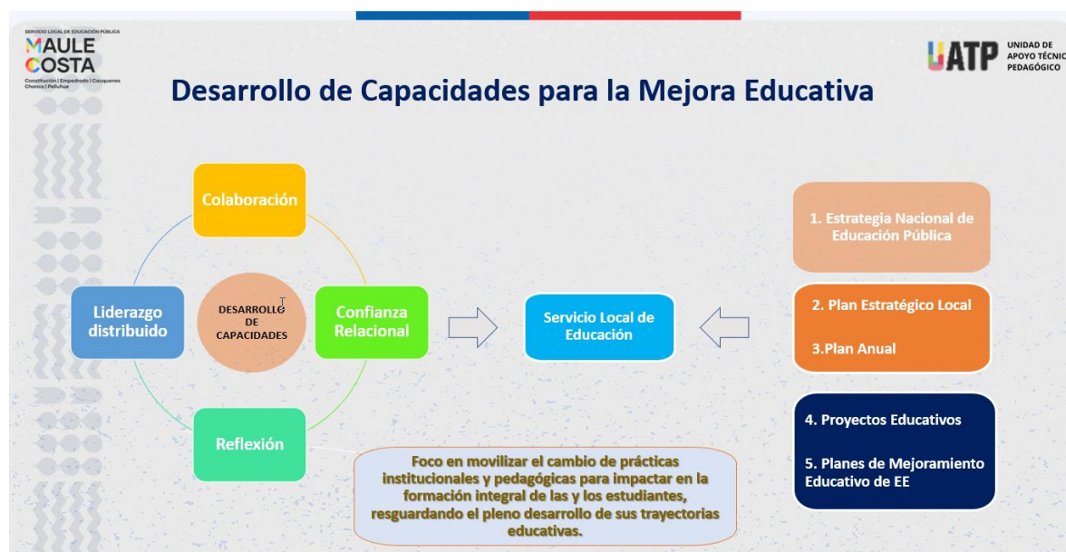
Cuadro n°1: Modelo de Desarrollo de Capacidades

Respecto al despliegue que ha tenido la UATP en el territorio se presenta la planificación de las reuniones en los DAEM y los equipos directivos de los EE, con foco en; convivencia y salud mental; asistencia y revinculación; fortalecimiento de los aprendizajes.